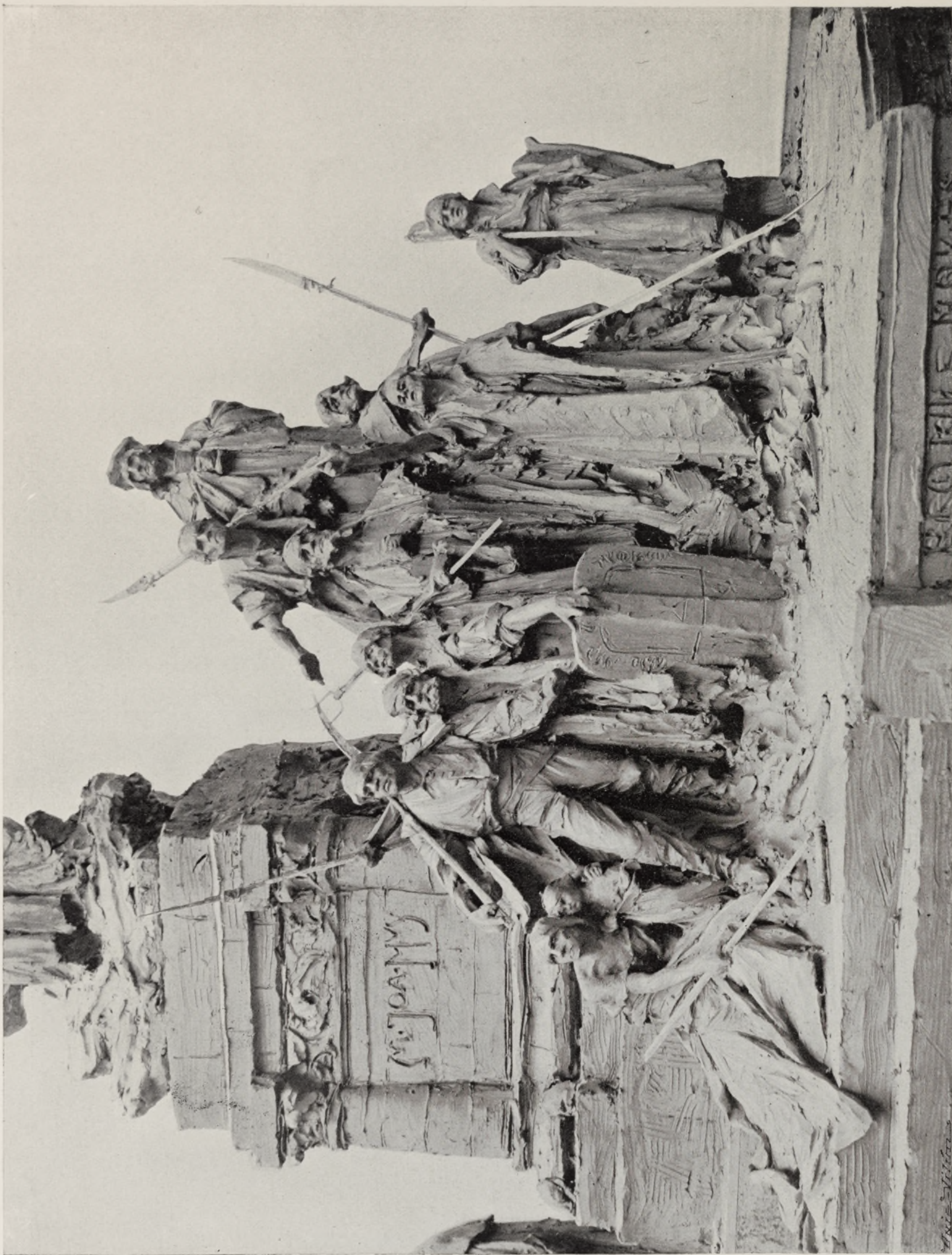
LAD. SALOUN. — I. CENA. DETAIL