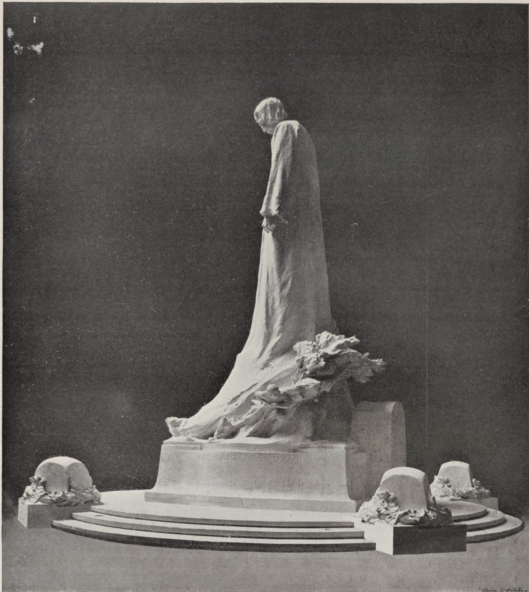
NÁVRH STANISLAVA SUCHARDY. SPOLUPRACOVNÍK JAN KOTĚRA.