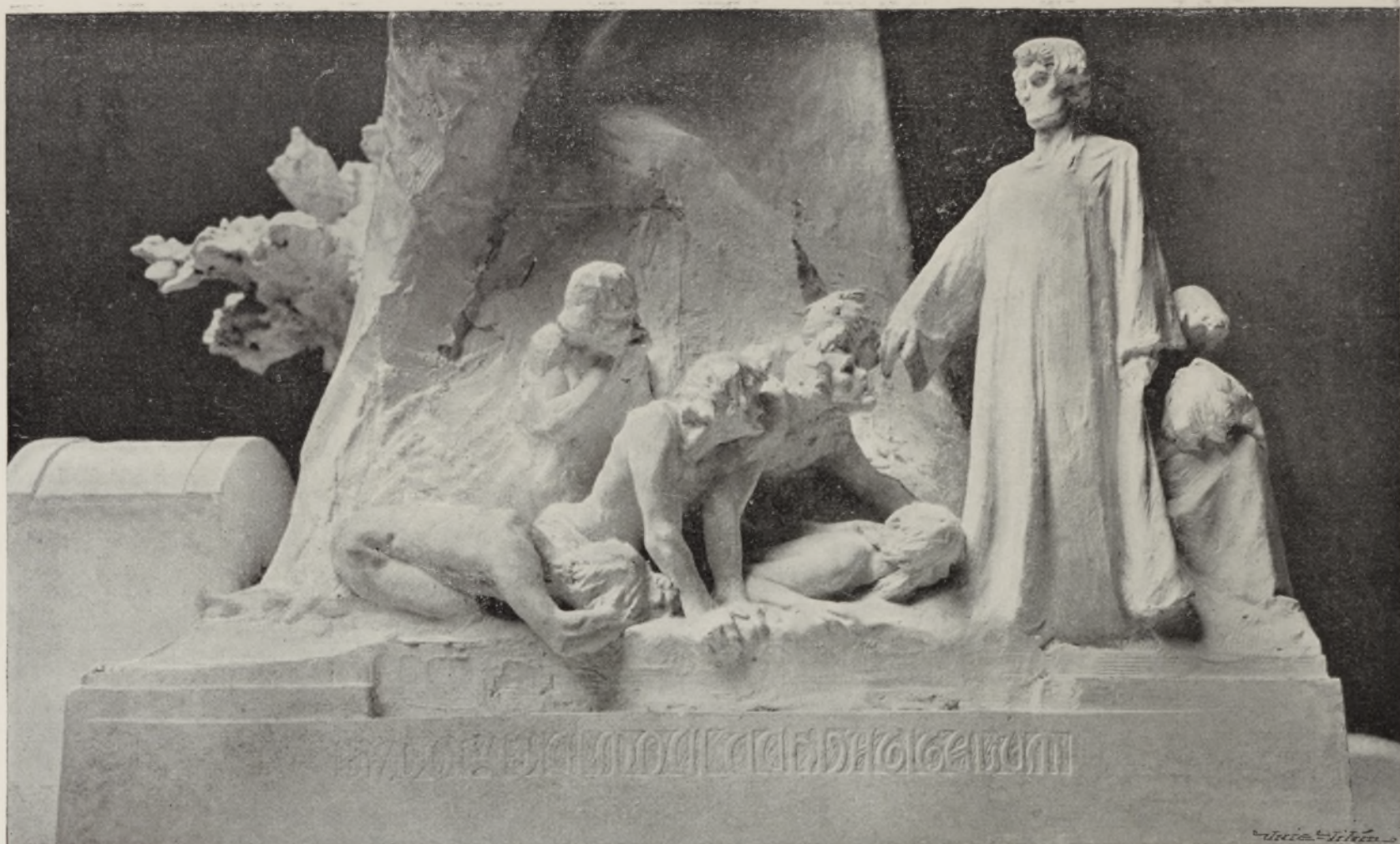
ST. SUCHARDA. DETAIL. ———

tom zúčastněna a to nikoliv jako pouhý přihlížitel a divák, nýbrž jako faktor velmi účinný a rozhodující. Předně tím, že sama na pomník skládá potřebný groš a sama tedy vlastně pomník staví. Více však nežli tento moment materiální, spadá na váhu okolnost etická, že totiž má býti nový pomník uměleckou realizací názoru a představ lidu o Husovi a epoše husitské vůbec. Pomník Husův má býti v pevný, viditelný tvar přenesený poměr dnešního národního citění k ohromné té evoluci, kterou kazatel betlemský na počátku patnáctého věku byl zahájil. Kterak ale má se uplatnit toto právo lidu a veřejnosti, když je nepřipustíte ku slovu dříve, až cizí porota svůj soud vynese a ceny rozdá? Dále pak dnes stavíme pomník ne podle dvorských dekretů a rozhodnutí absolutistických regentů, nýbrž z lidu a pro lid; pro mnohé generace a dlouhé věky. Tisíce a miliony lidí budou k němu pohlížet, jej prohlížet a měřit na něm své názory kulturní a umělecké. Pro ně se staví a není tedy tak správné, jak se několika lidem zdá, beze všeho ohledu na toto množství, na jeho city, přirozený smysl pro výraznost a krásu, jednoho dne postaviti před ně hotové dílo beze vší jeho morální účasti vzniklé.