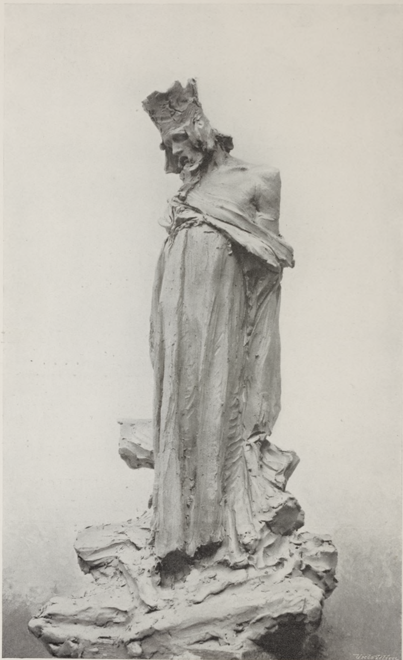
LAD. ŠALOUN. — I. CENA. DETAIL.